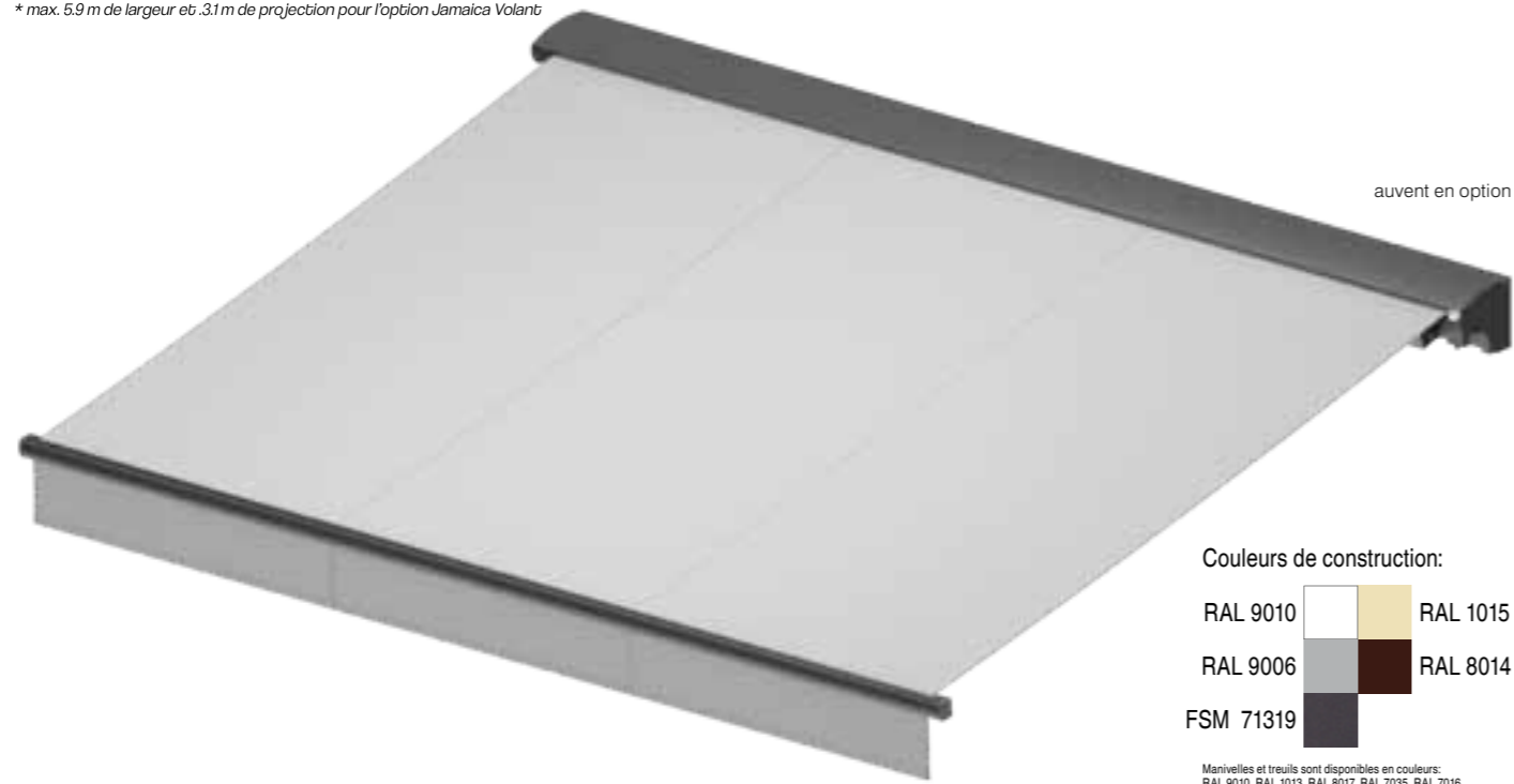
auvent en option